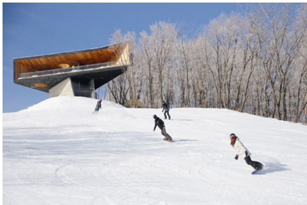
图4 松花湖雪道俯瞰图 25

万科对其客户群的深刻认识也延伸到其品牌选择和服务提供上。度假村的所有主要雪道均由宝马赞助，而宝马是中国中产阶级的标志性品牌。它还与北华大学和一家日本公司合作提供多种滑雪课程，该公司专门使用熊猫主题设备进行儿童滑雪训练。通过此类合作，万科希望能够吸引更多儿童参与滑雪运动，从而创造一个长期的客户群，同时也激励他们的父母更多地进行滑雪旅行。