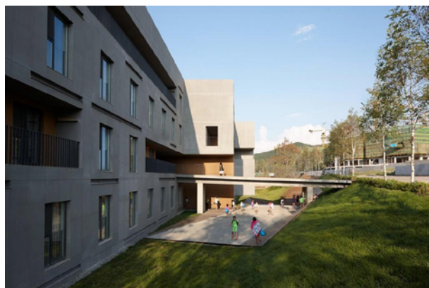
图6 夏季松花湖度假区青年公社 29

然而，滑雪仍然是松花湖的主要价值推动力。度假区最终要依赖于滑雪爱好者的稳定光顾。但是，无法确认是否目前国内对滑雪的兴趣能够持续到2022年北京冬季奥运会之后。早期的市场评估已经表明，万科必须努力发展稳定的客户群体。