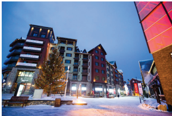
图5 松花湖度假区公寓楼 27

然而，万科的组织二元性更重要的表现在于坚持公司的价值观和文化：重视质量。由于松花湖滑雪场的大部分客户都无法分辨出雪质的差别，万科本可以选择提供基本的滑雪服务，并不需要投资造雪机等高端设施。此外，注重“血统”的精英滑雪者可能会选择较早开设的北大壶度假区，该度假区由附近的一家滑雪行业企业经营，并且已经举办过几个重要的赛事，包括滑雪世界杯和冬季亚运会等。